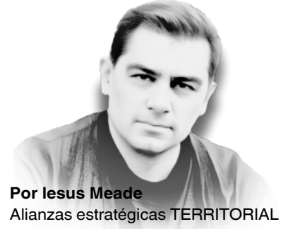
Por Jesus Meade Alianzas estratégicas TERRITORIAL

Entre la crítica y la empatía al presidente colombiano, Gustavo Petro: "Le ha ido muy mal gobernando, pero además no lo han dejado", dice la mayoría de los colombianos.